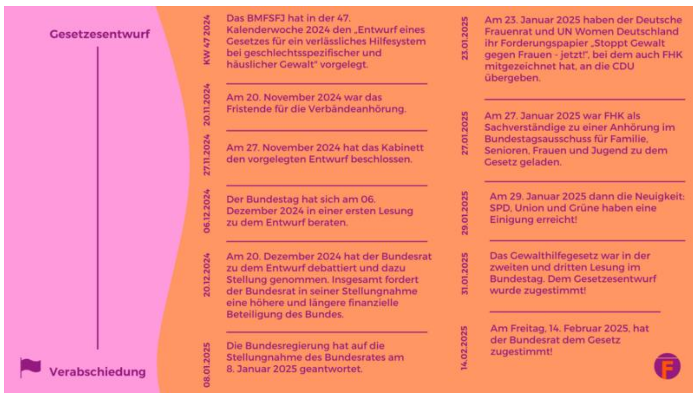
Grafik: Frauenhauskoordinierung e.V.

Wir fordern einen echten Rechtsanspruch auf Schutz und Beratung – barrierefrei, mehrsprachig, niedrigschwellig und unabhängig von Aufenthaltsstatus, Einkommen und Geschlechtseintrag.