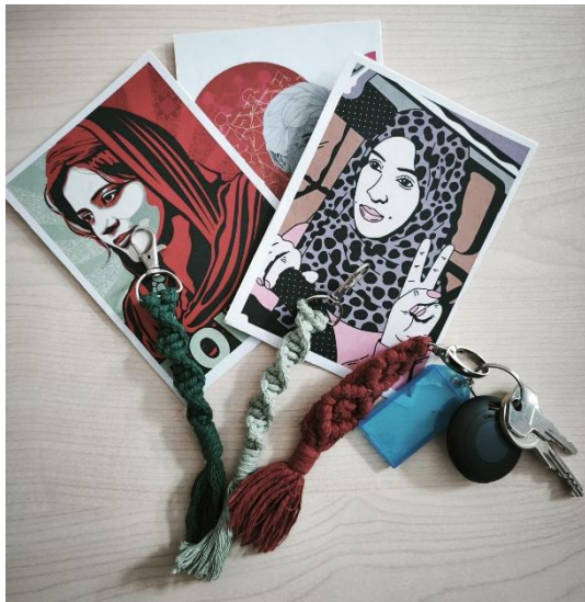
Anfertigen von Makramee Schlüsselanhängern