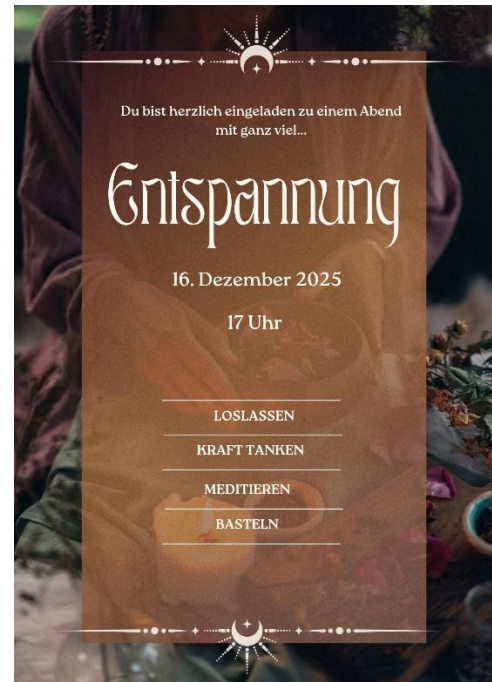
Entspannungsabend mit Bastelangebot und Meditieren