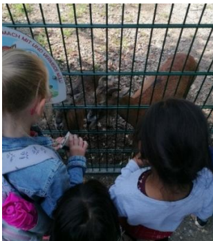
Ausflug zum Wildpark Höllohe

Im Folgenden befinden sich einige Impressionen der Aktivitäten: