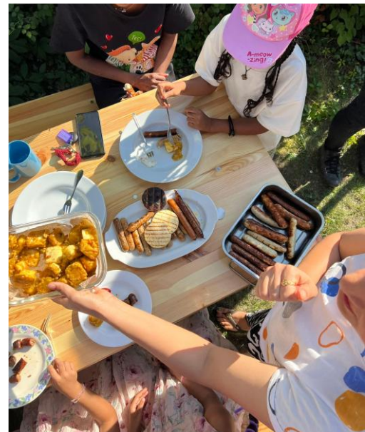
Sommerfest mit Grillen und Kuchen